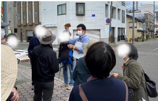
古川小学校周辺の説明（水路跡や、平成8年に旧校舎を解体した際に、階段の手すりを切断して作られた記念品も紹介）

* 今年度は2回開催する予定でしたが、新型コロナウイルス感染症拡大に伴い7月4日に開催予定の回を中止とし、1回のみで開催となりました。