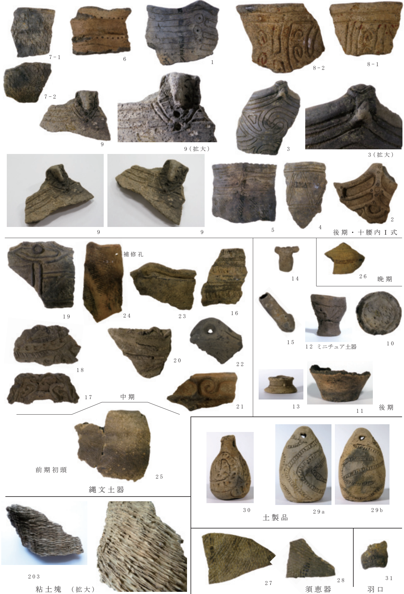
図3 土器・土製品・粘土塊 (市柳沼周辺)